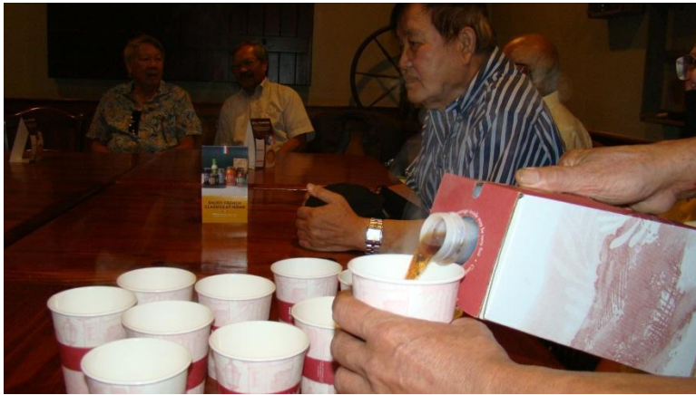
Chuẩn bị cà phê rót ra ly mời khách đến dự.