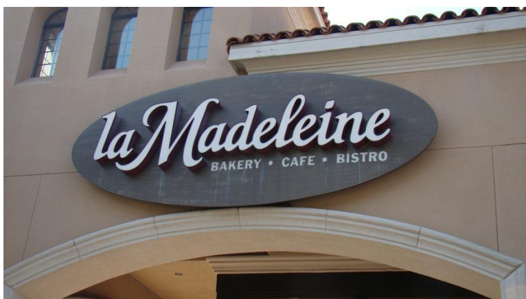
Cà phê La Madeleine (Houston, Texas)